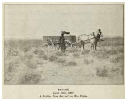
Mach was draus: subventionsfreier Siedleranspruch.

Vom Schnittpunkt eines nicht ohne Sorgfalt, aber doch letztlich aus freien Stücken gesetzten Meridians und einer Basislinie aus lässt sich die Lage der Farm ermitteln, indem man 34 Planquadrate in der Vertikalen nach oben, sprich Norden, und 99 Planquadrate in der Horizontalen nach links, sprich Westen zählt. Diese Quadrate wurden Townships genannt. Jedes Township erhielt auch noch einen Eigennamen, was ihm den Anstrich einer echten Verwaltungseinheit verlieh, im Grunde aber nur zu einer verwirrenden Interferenz mit der Bezirksordnung der Countys führte. Das angepeilte Planquadrat wurde in weiterer Folge in sechsendreißig Sektionen von je einer Meile in der Länge unterteilt, die in sechs alternierenden Reihen von rechts oben nach rechts unten durchnummeriert zu werden pflegten. Kein normaler Mensch wäre ohne spezielle Township Map in der Lage gewesen, mit dieser Adresse von sich aus den durch sie bezeichneten Ort zu finden. Im Grunde hat man es mit einem verwaltungstechnischen Code zur eindeutigen Lokalisierung von Grundstücken durch die Behörden des General und District Land Office zu tun. Für unsere Zwecke genügt der Hinweis, dass der Meridian des 6h Principal so weit im Osten lag, dass er den Missouri tangierte, die Basislinie an die 650 Statutmeilen betrug und damit die längste derartige Linie auf dem Staatsgebiet der Vereinigten Staaten war und Louises Farm im nordwestlichen Winkel dieses über vier Bundesstaaten sich erstreckenden