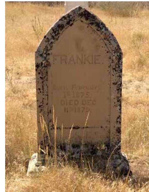
Im Land der Shoshonen: Louisas Sohn.

Wyoming war inzwischen soweit erschlossen, dass für dieses Land eine eindeutige Adresse vergeben werden konnte. Dessen geographische Verortung unter 6 th Principal Meridian, Township 34 North, Range 99 West, Section 30 und 31