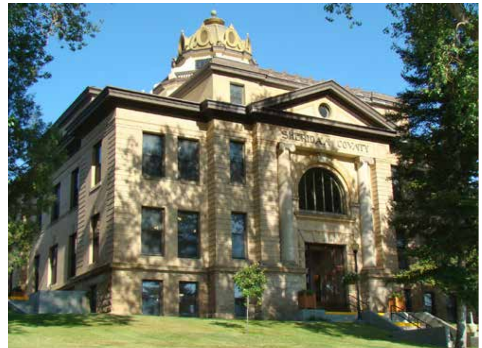
Ort von Entscheidungen: Sheridan County Courtyard, Wyoming.