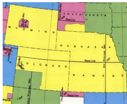
Lange Linie: Vermessungsgebiet 6th Principal Meridian.

Vermessungsgebietes lag (Abb.). Dieses war wenige Jahre vor der Verabschiedung des Homestead Act etabliert und sukzessive nach Westen erweitert worden. Wer sich die Unwägbarkeiten des bergigen Geländes vor Augen führt und zudem auch noch im Hinterkopf behält, dass sich die Vermessungsquadrate nach Norden hin mit der Erdkrümmung verjüngten, der dürfte erahnen, welchen Schwierigkeiten der Landvermesser gegenüberstand, wenn es darum ging, die abstrakte Messordnung auf die konkreten Verhältnisse herunterzubrechen.