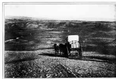
The Wind River stage.