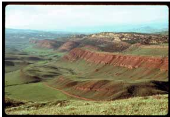
Scenic View: Von South Pass City 30 Meilen nordwärts.